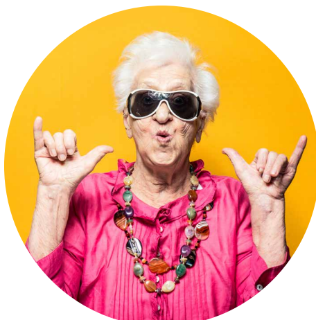
Mrs SOCIAL SECURITY