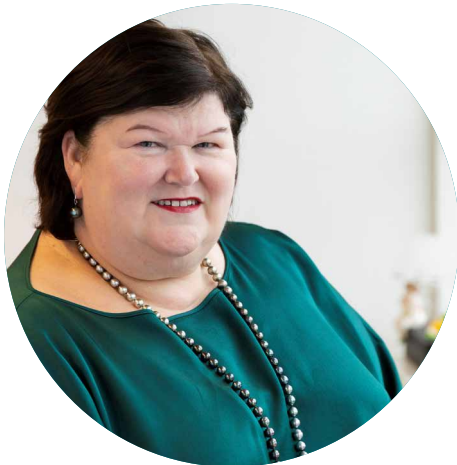
MAGGIE DE BLOCK

Minister van Sociale Zaken en Volksgezondheid en van Asiel en Migratie